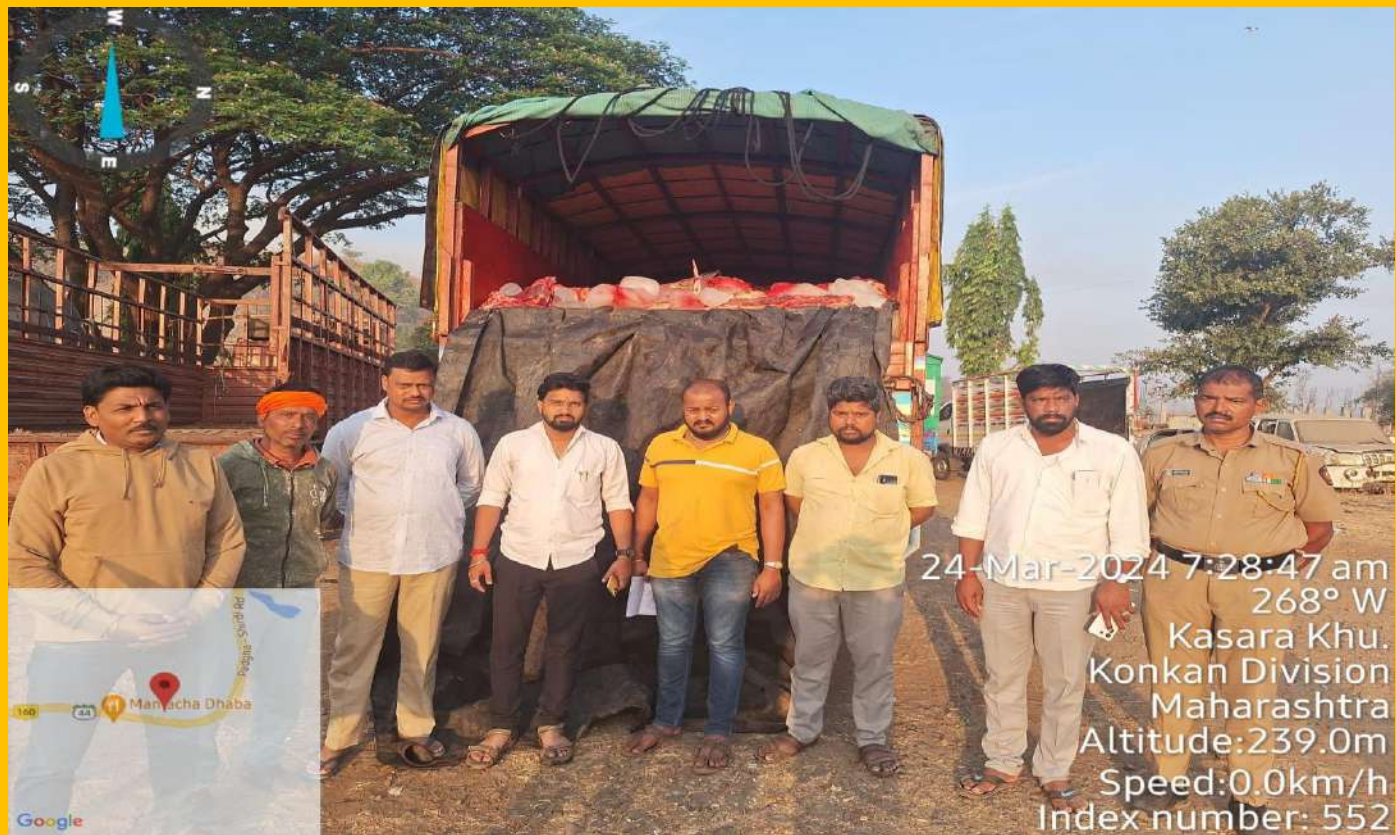
Illegally slaughtered cow Beef transporting vehicle intercepted and seized by our volunteers