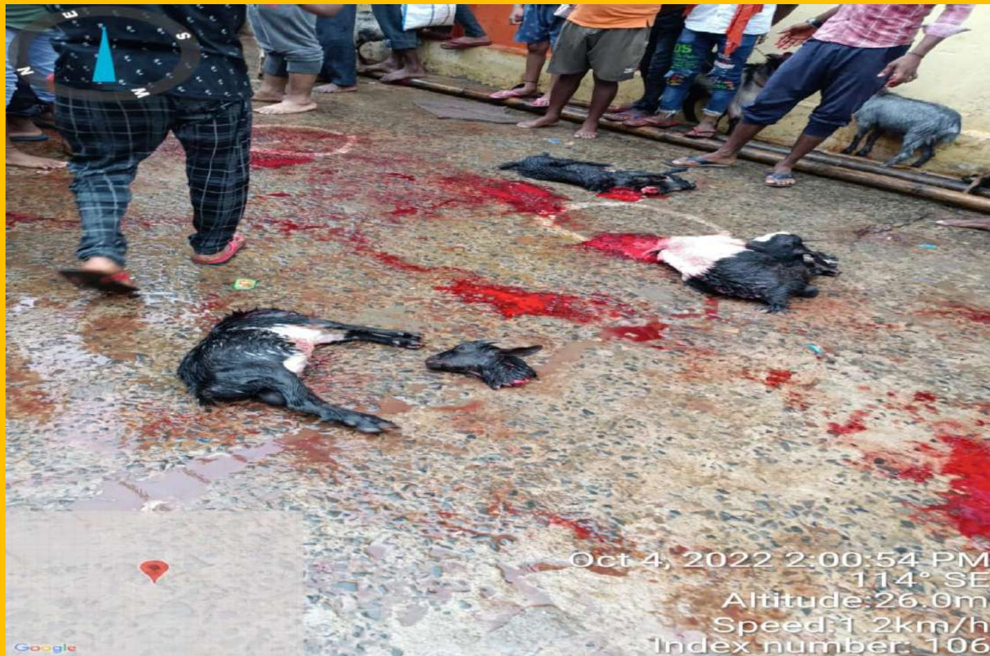
Animal Sacrifice in Temples