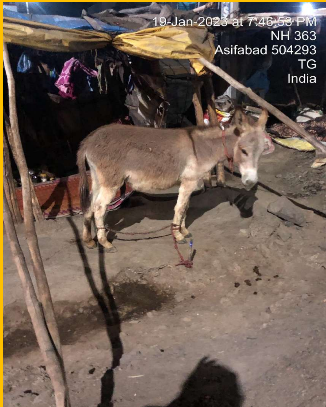
Donkey kept under captivity for slaughtering outside illegal slaughter house in Karnool, Andhra Pradesh. Akhil Bharat Kris Go Seva Sangh filed petition in Andhra Pradesh High court seeking action against illegal butchers who brutally slaughter the Donkey for meat and impotency promoter medicine.