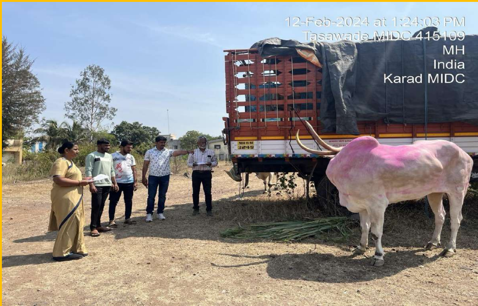
Illegal trafficking of Animals for Bakri Eid. Vehicle seized and taken custody by our volunteers