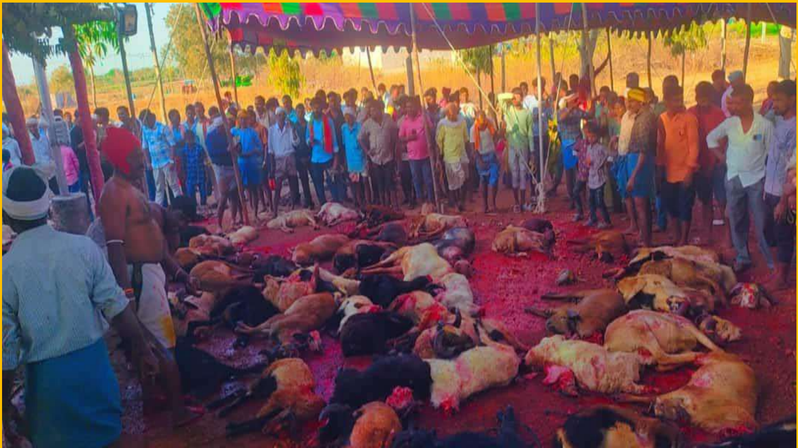
Animal sacrificing in Temple in front of children and police